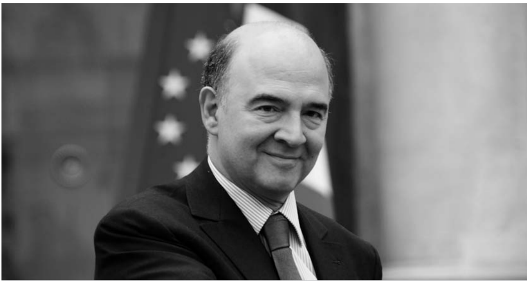
IL-Kummissarju Ewropew għall-Ekonomija, Pierre Moscovici

Ftit tal-granet ilu fuq il-mezzi tax-xandir thabar li fil-Kunsill tal-Ministri tal-Finanzi tal-Unjoni Ewropea, kunsill li jissejjaħ ECOFIN, intlaħaq ftehim fuq id-direttiva dwar l-evitar tal-ħlas ta' taxxa. Meta ngħidu "evitar ta' taxxa" jfisser meta wiehed juża s-sistema u r-regoli tat-taxxa b'mod legali biex inaqqas u jhallas mill-inqas taxxa possibbli.