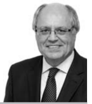
EDWARD SCICLUNA / Ministru tal-Finanzi