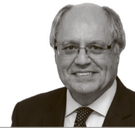
EDWARD SCICLUNA / Ministru għall-Finanzi